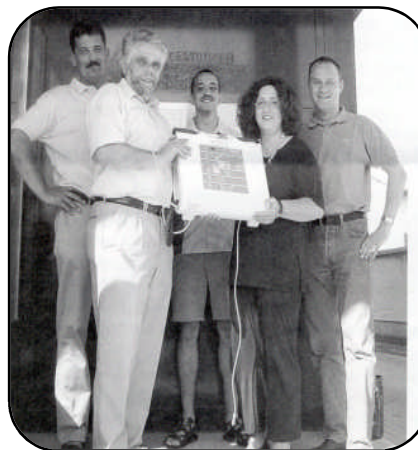
StR. Jakl, Mag. Ram und priv. Spender mit der Leiterin des Notarztteams

Schwechat hat die mit Abstand höchsten Pro-Kopf-Steuererinnahmen aller österreichischen Städte. Der ständig wachsende Flughafen sorgt jährlich für Rekorderinnahmen bei der Kommunalsteuer. Wofür wird aber das viele Geld ausgegeben? Oder anders gefragt: Was gibt es in Schwechat mehr, dass vergleichbare Städte wie Mödling, Baden, Klosterneuburg oder Tulln nicht auch haben. Auch diese Gemeinden verweisen mit Recht auf ihre hervorragenden kommunalen Einrichtungen wie Seniorenbetreuung, sozialer Wohnbau, Kultur-, und Freizeiteinrichtungen, gepflegte Parkanlagen und vieles mehr. Eines haben sie aber Schwechat voraus: Sie haben alle ein eigenes Spital. Obwohl sie deutlich weniger Steuererinnahmen als Schwechat haben, ist ihr Pro-Kopf-Schuldenstand noch dazu wesentlich geringer. Scheinbar muss in Schwechat etwas falsch gemacht werden. Das viele Geld wird offensichtlich nicht immer sinnvoll und bürgernah eingesetzt.